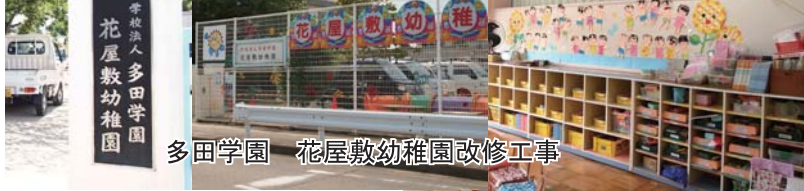
多田学園 花屋敷幼稚園改修工事