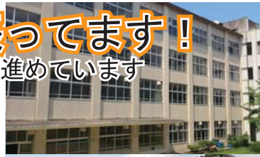
川西市立多田小学校の耐震工事