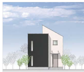
片流れ屋根のシンプルモダン