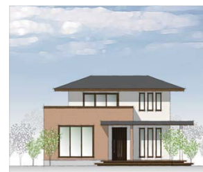
落ち着いた感のある洋風