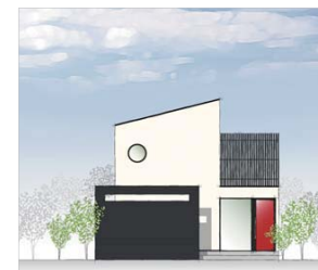
シンプルな和モダン