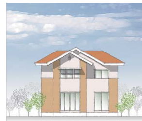
明るい色合いの南欧風