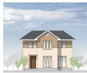
明るい雰囲気の洋風モダン